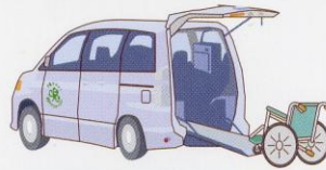
車いすのままラクラク乗車

車両のご案内 ベットからベットまでの移送介助対応。付き添いの方も、大型車の場合8名様まで同乗できます。