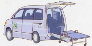
ストレッチャーで寝たまま乗車